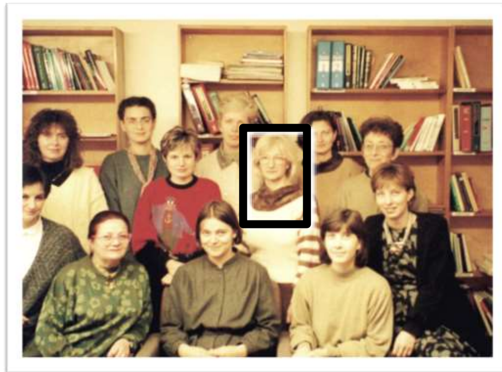
Membru fondator al ANIP